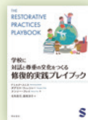
学校に對話と 尊重の文化をつくる 修復的実践プレイブック